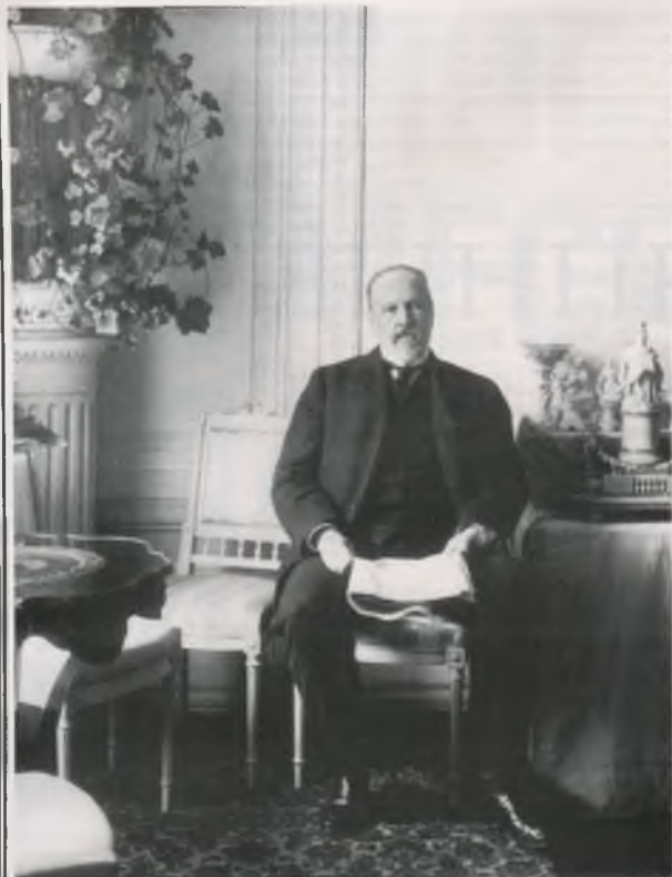
◀ Граф Витте стал отцом русского парламентаризма благодаря обычным дворцовым интригам