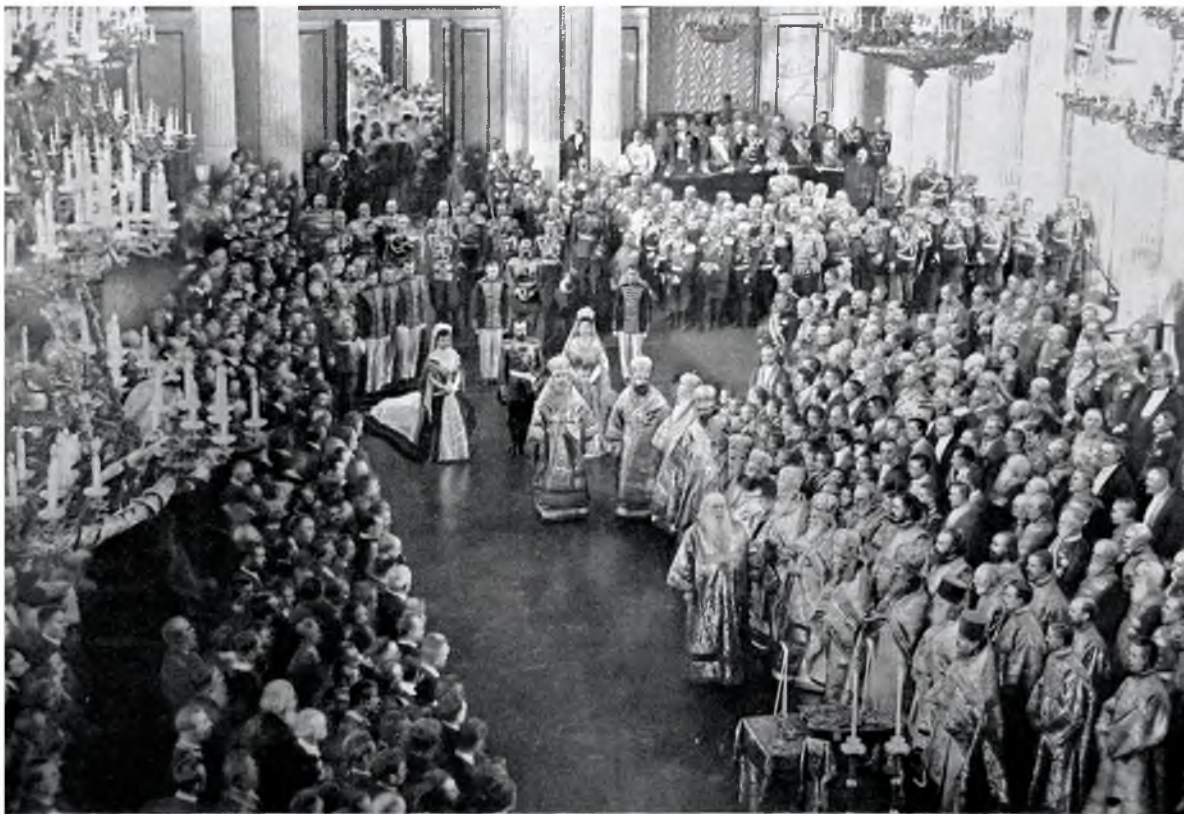
Молебенъ въ Зимнемъ Дворцѣ 27 апрѣля 1906 г. передъ открытіемъ Государственной Думы.

В то время когда Запад под воздействием буржуазных революций всюду экспериментировал с демократическими институтами, жившая под тяжелым скипетром монарха Россия продолжала спать сном крепостнической летаргии, гордясь своей самобытностью и сильно сомневаясь в том, что когда-либо пойдет по пути Европы. Объявив, наконец, крестьянскую волю, царский режим не торопился снимать с него цепи, пока полвека спустя не грянула революция 3 .