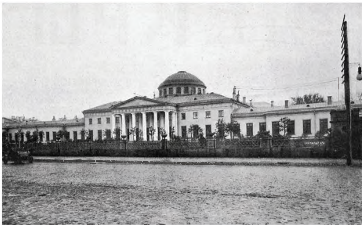
Видный вид Таврического дворца, отведенного для Государственной Думы.