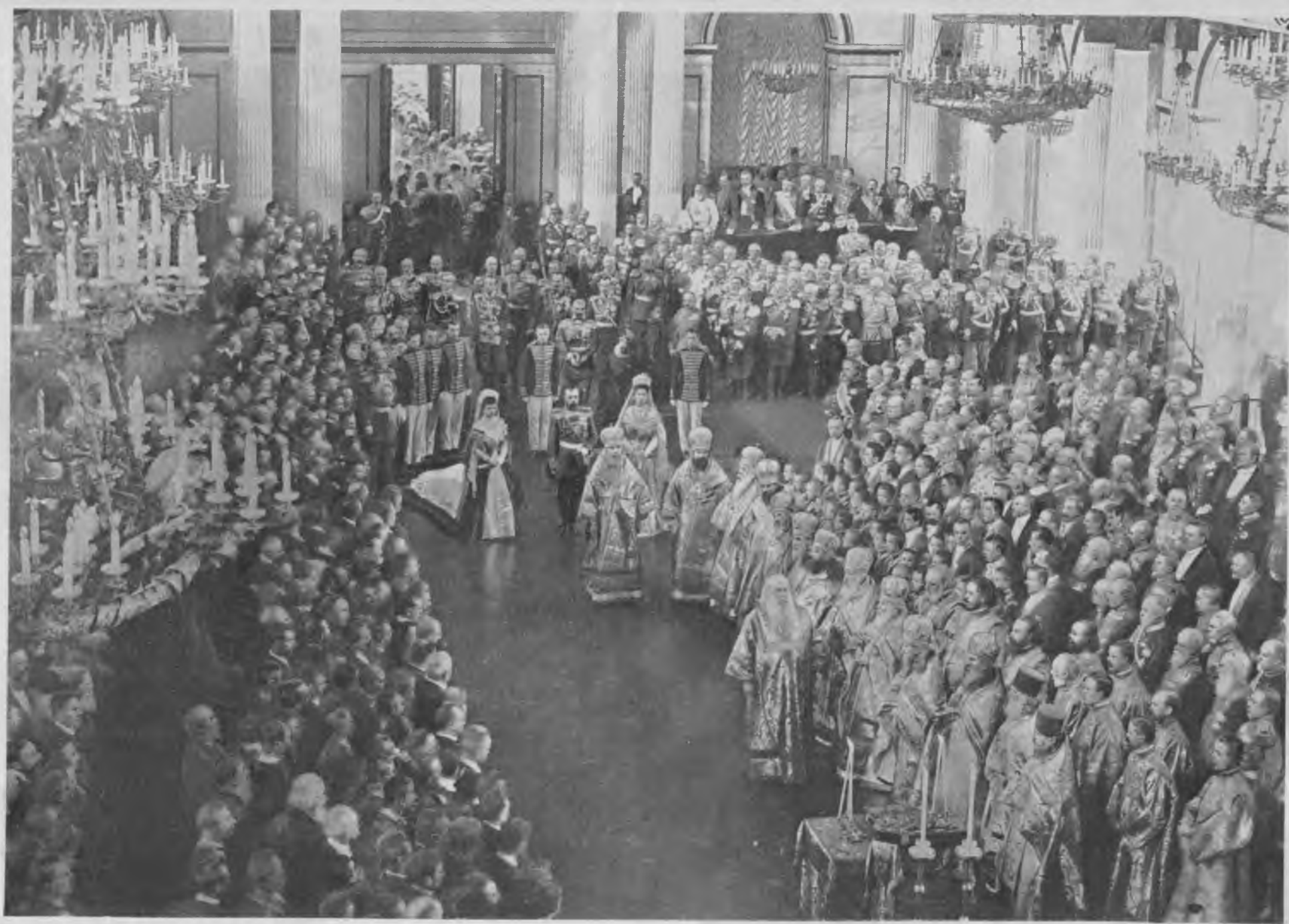
Молебенъ въ Зимнемъ Дворцѣ 27 апрѣля 1906 г. передъ открытіемъ Государственной Думы.