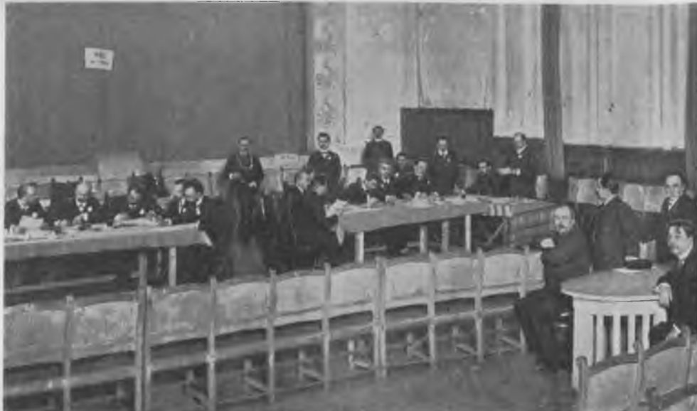
Выборы в Государственную Думу в Москвѣ. Подсчет избирательных бюллетеней в Арбатскомъ участкѣ.