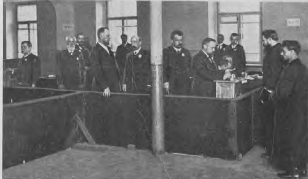
Выборы в Государственную Думу в Москвѣ. Подача голосовъ избирателей в Прѣсенскомъ участкѣ.