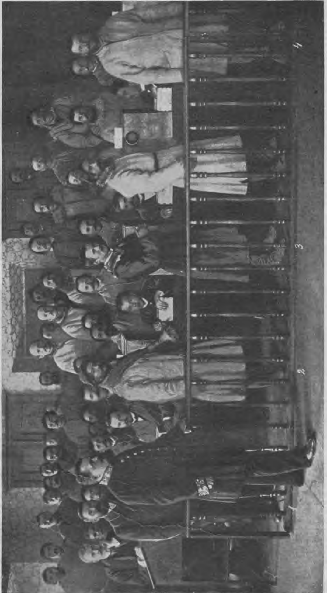
Съездъ уполномоченныхъ отъ волостей Кобринскаго уѣзда, Гродненской губ., для избранія выборщиковъ въ губернское избирательное собраніе. Избраніе въ выборщики отмѣчено цифрами. Слѣва — въ мушкетрѣ предводител. дворянства.