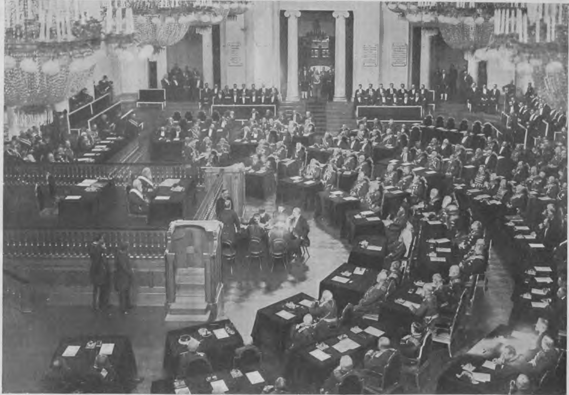
Открытие засѣданій обновленнаго Государственнаго Совѣта въ залѣ Дворянскаго Собранія, 28 апрѣля 1906 г.