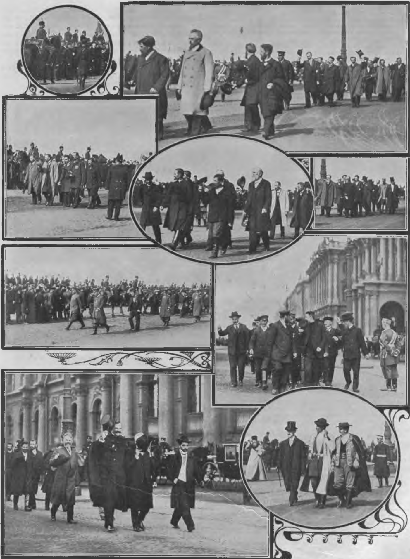
Члены Государственной Думы у Зимнего Дворца послѣ Высочайшаго выхода—27 апрѣля 1906 г.