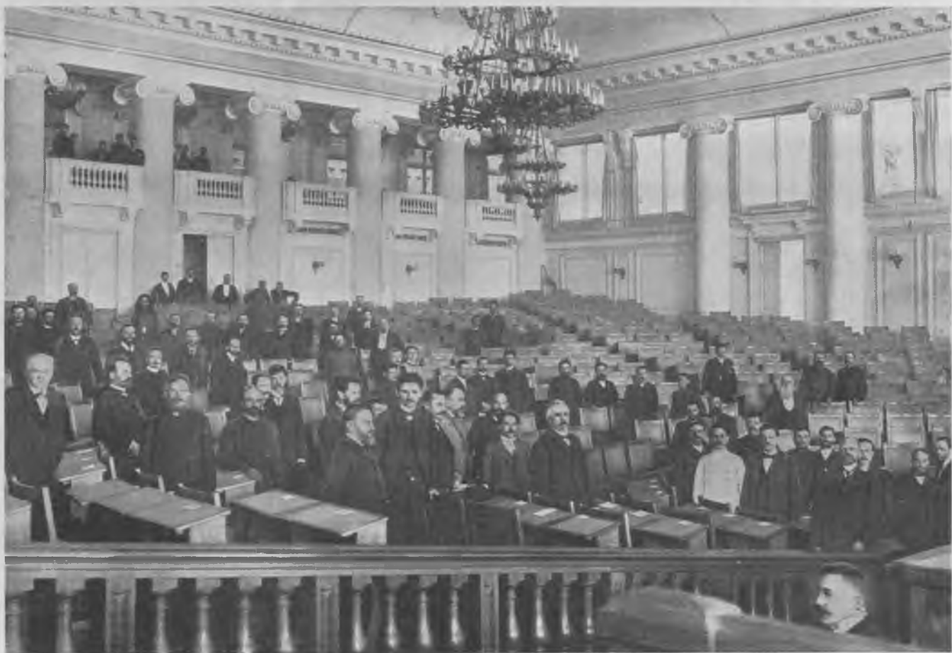
Члены Государственной Думы выбираютъ себѣ мѣста въ залѣ засѣданій 25 апрѣля с. г. Наканунѣ открытія Государственной Думы.

Затѣмъ начались продолжительныя пренія о способѣ баллотировки должностныхъ думскихъ лицъ. Дума, въ лицѣ ея многочисленныхъ представителей, выразила страстное желаніе поскорѣе покончить съ формальностями этого избранія и принять первый предложенный порядокъ выборовъ, но въ противовѣсъ такому стре-