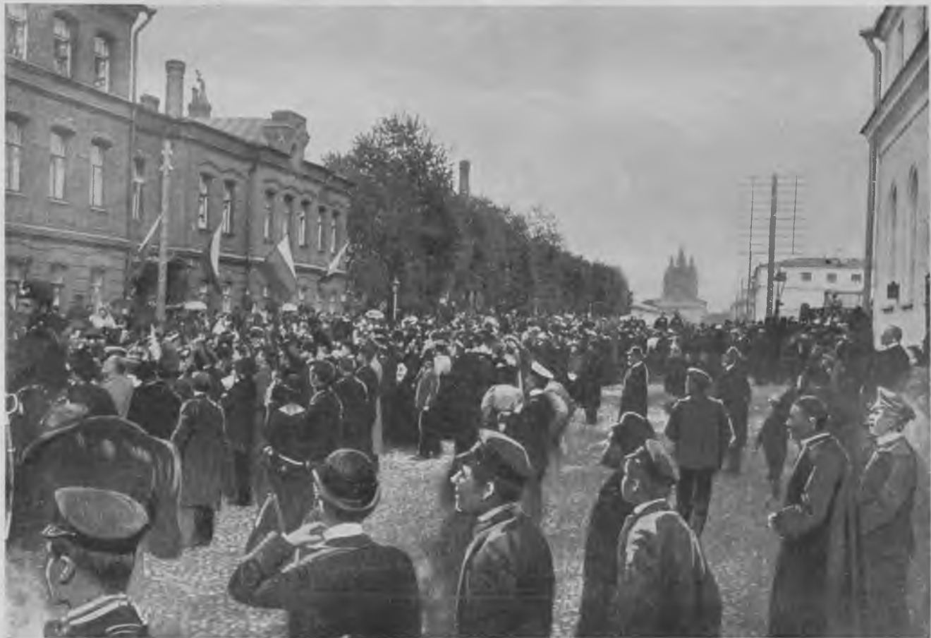
Народъ привѣтствуетъ депутатовъ по окончаніи перваго засѣданія Государственной Думы у клуба конституціонно-демократической партіи.