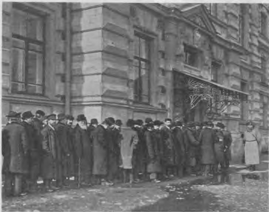
Выборы в Государственную Думу в Москвѣ. Избиратели в ожиданіи очереди в Прѣсенскомъ участкѣ на Садовой, у дома реального училища.