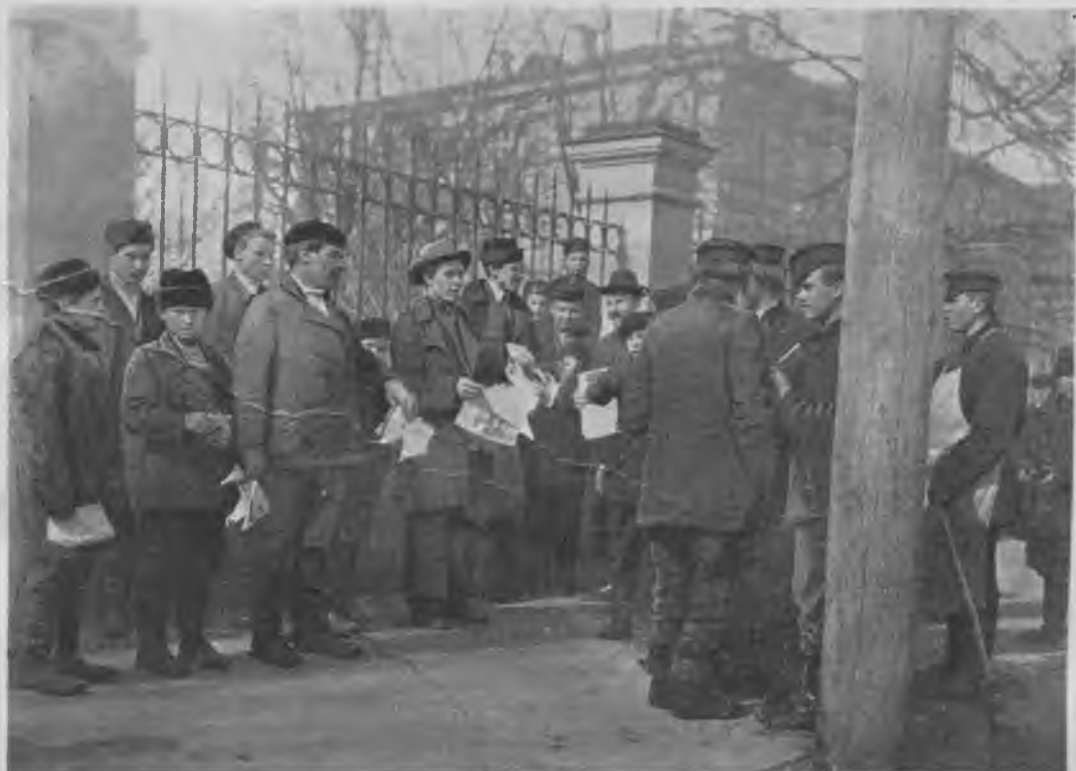
Выборы в Государственную Думу в Москвѣ. У Вдовьяго дома на Садовой. Агитаторы и нанятые ими лица, предлагающіе публикѣ партійныя программы.