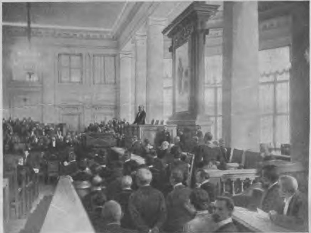
Первое засѣданіе Государственной Думы въ Таврическомъ дворцѣ 27 апрѣля 1906 г. Рѣчь С. А. Муромцева послѣ избранія его председателемъ Думы.