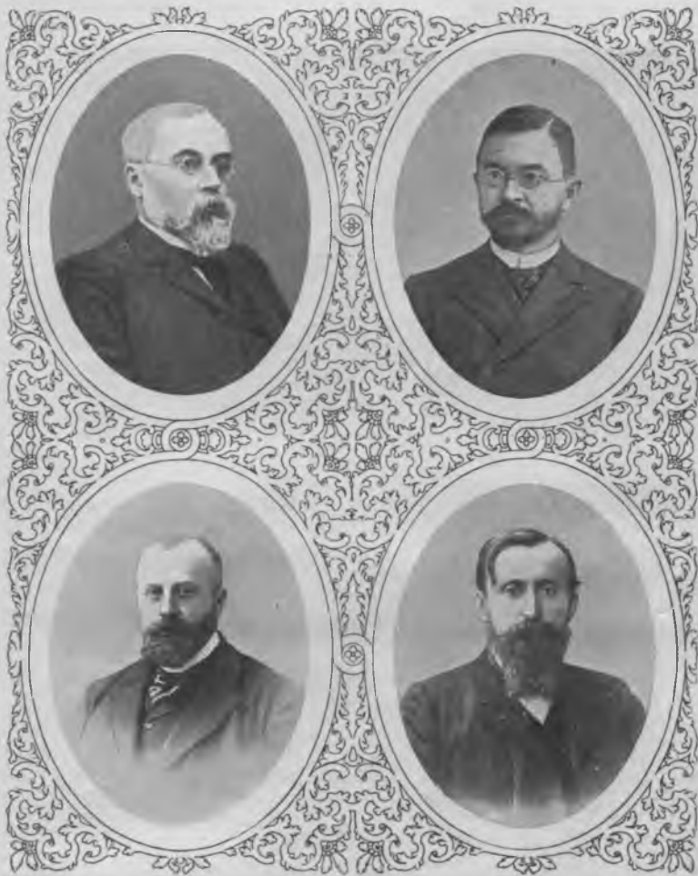
С. А. Муромцевъ. Князь Петръ Долгоруковъ.